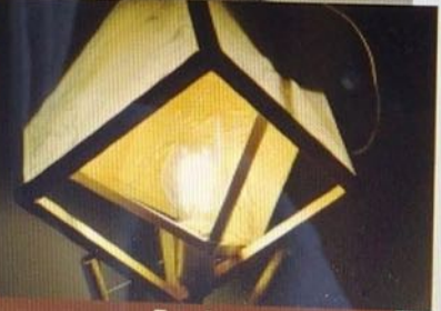
Danke für die Aufmerksamkeit!