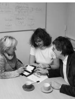
Schulorganisation im Team