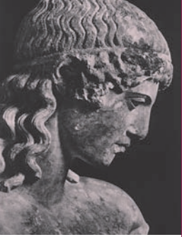
Apoll aus dem Tiber, Studienfahrt Rom